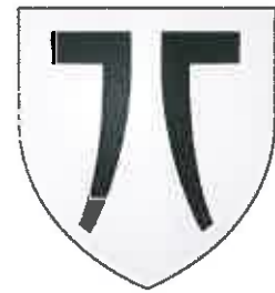
COMMUNE DE WHIR-AU-VAL