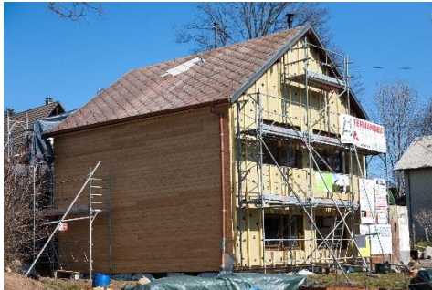
Panoramaweb – Pascal SCHWIEN

Vous avez un projet de rénovation énergétique pour votre habitation ?